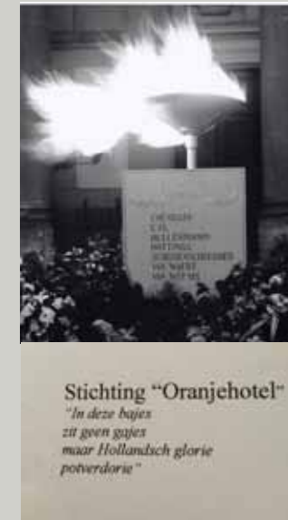
Stichting "Oranjehotel" "In deze bijes zit geen gajes maar Hollandisch glorie potverdorie"