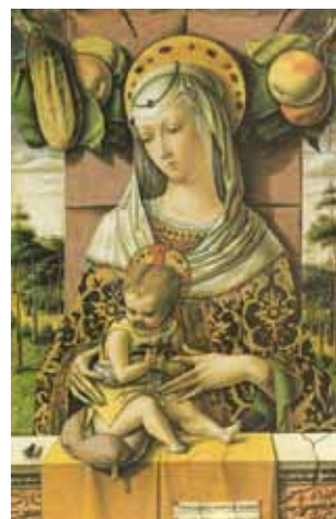
Vlnr: Heilige Familie Ulm (Onbekende maker, Laat-Middeleeuws), Ikonenwand met Tsarendeuren (Russisch Orthodox), Madonna met kind (Carlo Crivelli ca 1480 Venetië, Renaissance)